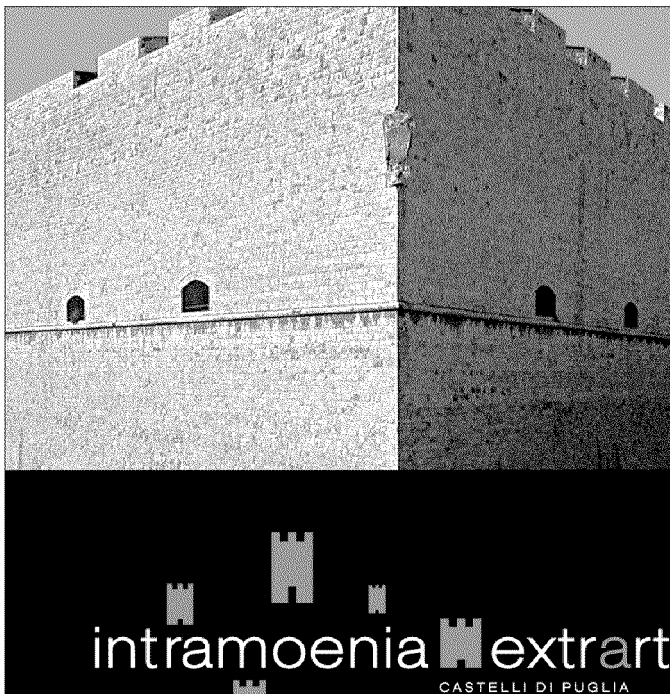
La locandina della mostra

La rassegna a Barletta si è chiusa domenica 20 settembre, ma la riapertura straordinaria del 23 settembre offre l'occasione ultima di visita continuata (dalle ore 16 alle 22) e una serata di festa con un variegato programma di interventi e momenti di spettacolo tra proiezioni e musica. Si inizia alle ore 19 con i saluti del presidente della Regione Puglia Nichi Vendola , dell'assessore regionale al Mediterraneo Silvia Godelli , del soprintendente regionale per i Beni Culturali e Paesaggistici della Puglia Ruggero Martines e del sindaco di Barletta Nicola Maffei . Achille Bonito Oliva , direttore scientifico del progetto e Giusy Caroppo , curatrice generale, moderati dalla curatrice ese-